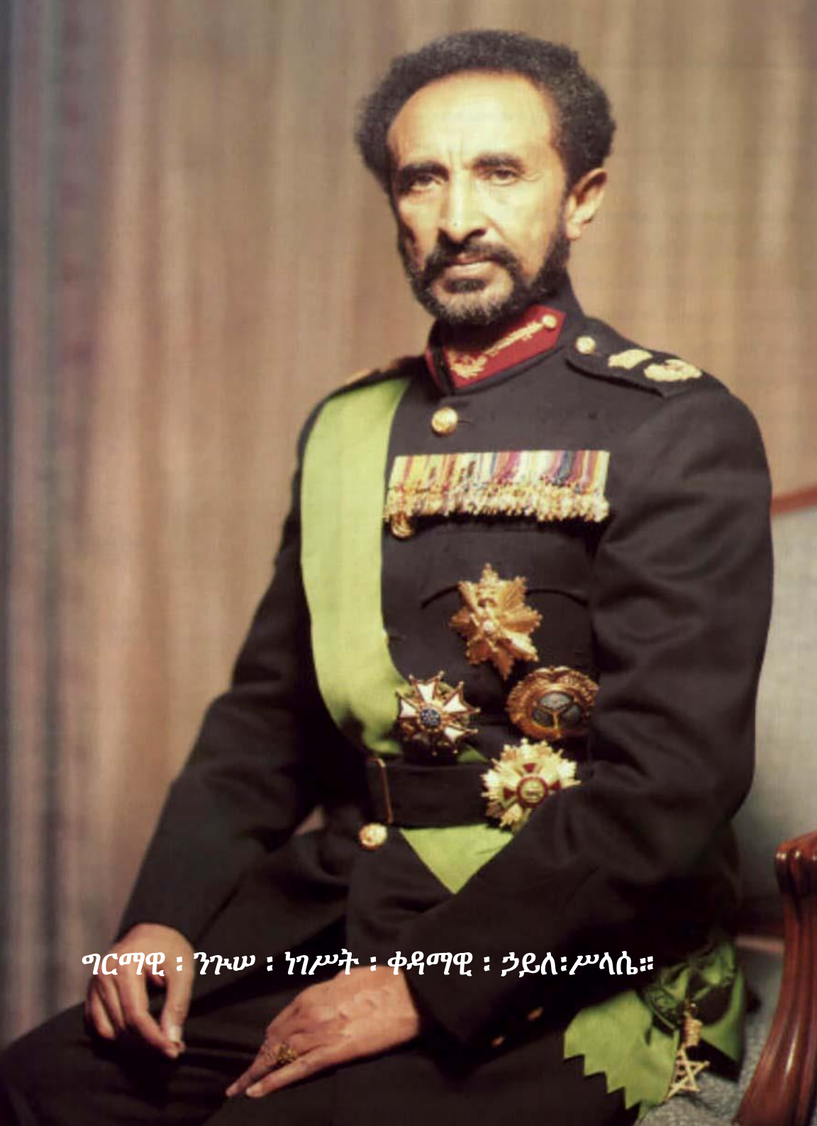
ግርማዊ ፡ ንዑ ፡ ነገሥት ፡ ቀዳማዊ ፡ ኃይለ፡ሥላሴ።