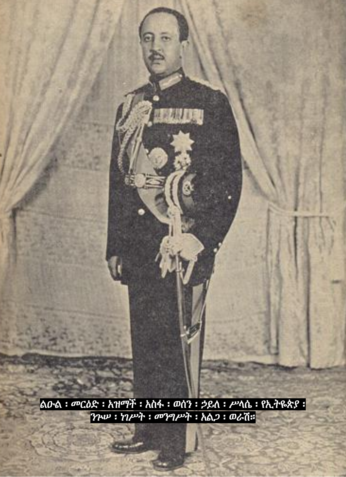
ልዑል ፡ መርዕድ ፡ አዝማች ፡ አሰፋ ፡ ወሰን ፡ ኃይለ ፡ ሥላሴ ፡ የኢትዮጵያ ፡ ንጉሠ ፡ ነገሥት ፡ መንግሥት ፡ አልጋ ፡ ወራሽ።