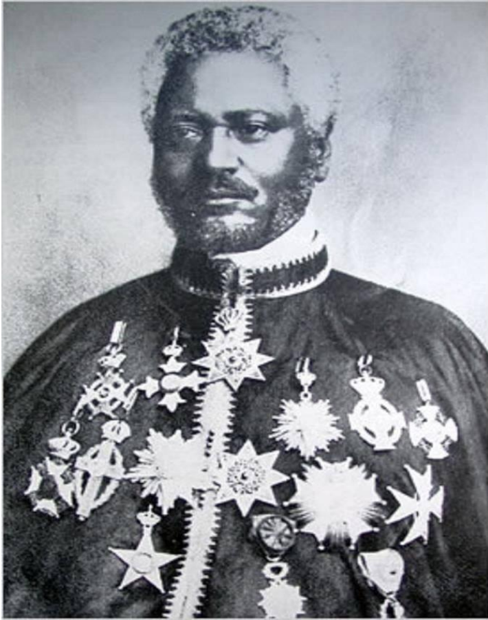
ከብሉጽ ጌታ ኅሩይ ወልደ ሥላሴ