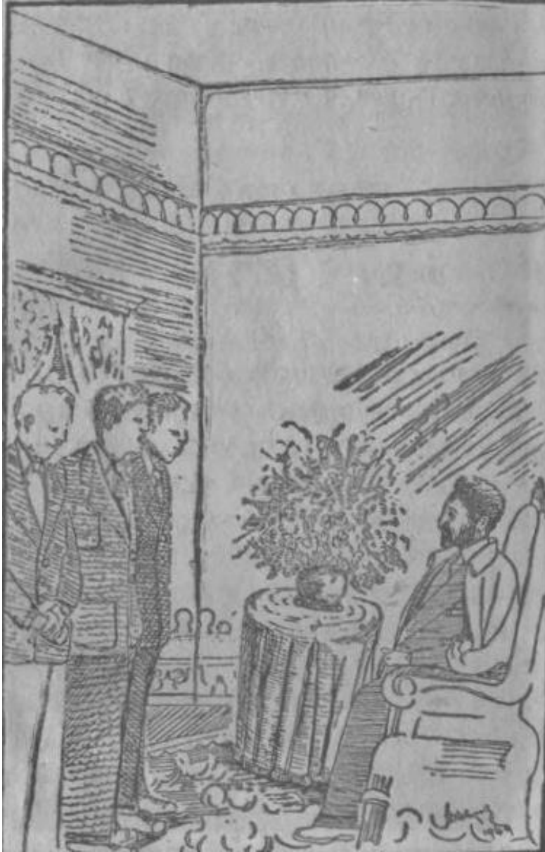
ገጽ ፳፯። የኢትዮጵያ ስም እምዲልቅ....