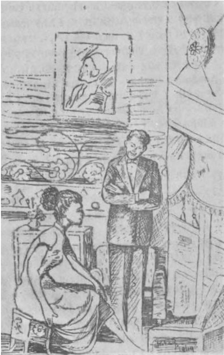
ገጽ ፲፭። የዕድላችን መሐንዲሶች .....