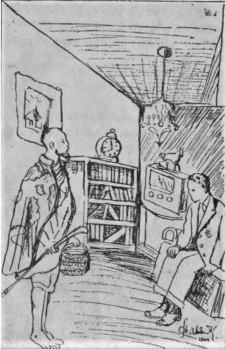
ገጽ ፻፳፪። ምንከፋኝ ጌታው ፣>> ይሉና.....