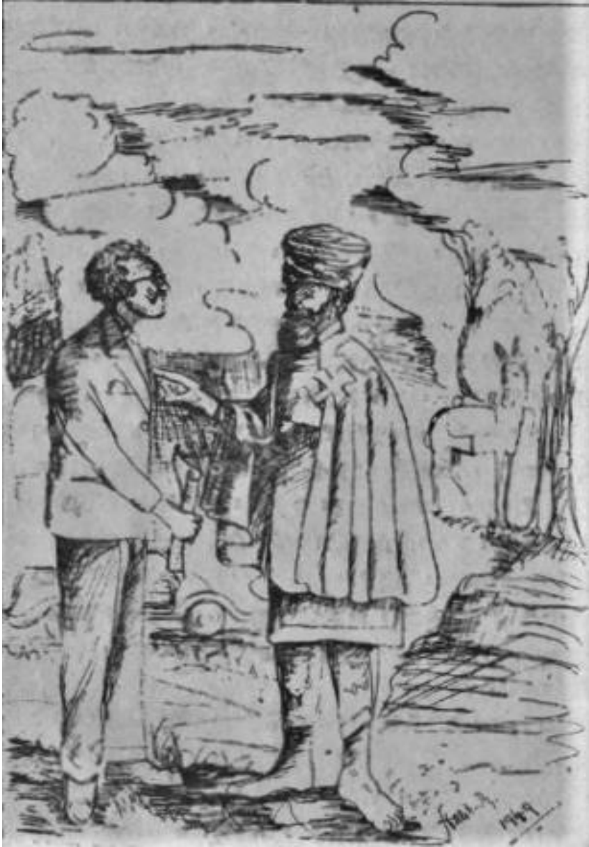
ገጽ ፱ ስሙ አቶ አባይ >> አሉ አለቃ ከገፈ